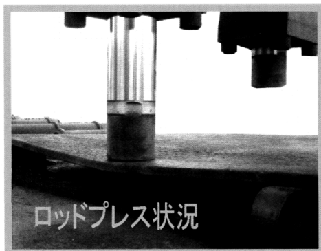
ロッドプレス状況