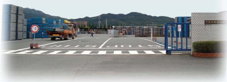
福岡機材センター

三信産業株式会社は、1974年(昭和49年)に大分県で初の建設仮設機材リース・レンタル会社として設立し、今日まで営業してまいりました。